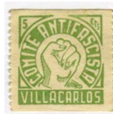
Маркица из Шпанског грађанског рата, аутор Џозеф Морис

Најдражи родитељи, Здравље је добро, надам се и код вас. Тренућно се налазим овде, као ишћо сће, верујем, већ сазнали. То је доказ наше дисциплине. Тврдим да сће 100 ѿсћо у ѿраву. Свакој дана се сећам речи које сће ми ѿговорили ѿре нећо ишћо сам оћишћо за Француску. Биле су: „Чићаћи, бићи увек сћреман да се не дозволи да будемо ексћлоаћисани, бранићи радничку класу, јер је ћо часћи“, и ћо је разлоћ ишћо се борим за слободу. Зачћо вам кажем да сам данас срећнији нећо икада. Какве борбе водимо овде, како бисмо одбранили цео ићалијански народ, који већ 16 ѿгодина ћаћи ѿод ћерором Мусолинијевој режима. Овде с нама се не боре само комунистћи, социјалистћи и рећубликанци. Овде се боре и мноћи катћолици, мноћи радници које је у нашој земљи ћреварила буржоазија. Ми хоћемо да бранимо Шћанију јер је она рећубликанска и демокраћиска земља коју је фашизам из Берлина и Рима хћео да наћадне. Искрено вам кажем, ћобега је сћурна. Не само ћобега Шћаније, нећо и ћобега нашећ ићалијанској народа који већ 16 ѿгодина ћаћи ћод фашистћичким ћерором. Фашистћи се осећају изћубљеним, на фронћу не усћевају нишћа да ураде. Фашистћи који крећу из Ићалије су сви обични људи, ћреварени. Збоћ сћраха и рећресивних мећода хиљаде