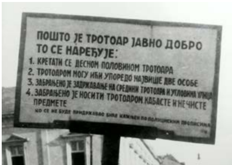
Табла у Кнез Михаиловој улици у Београду 1942. године, аутор Риста Марјановић

Моју гечурлију мноо поздравите и рецијте да буду добри. Све што можемо од ствари оставићемо Ружи ако остане чистава. Мноо поздрава моме Флауеру. Воли све Јока.